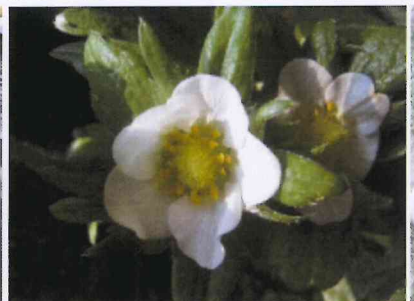
♪11.14 苺の花が咲き、棒綿 で受粉しました。