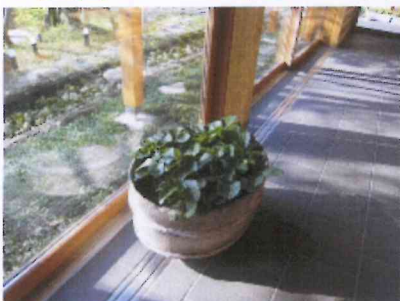
♪11.14 飼葉桶のプランター

*土間* ・・・いちご・・・とちぎといえば「い・ち・ご」土間の環境が最適！らしいので実験中です。アドバイスは直売所組合員さんです。