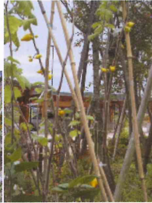
♪10.24 「フォックスフェース」