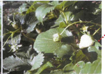
♪12.15 クリスマス頃 BEST!