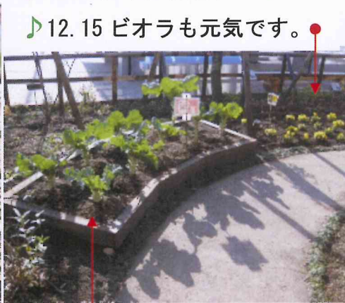
♪12.15 ビオラも元気です。